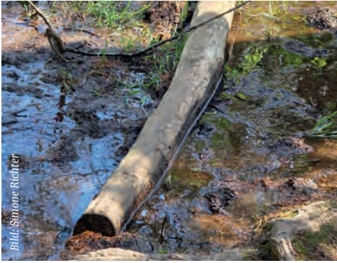
Bewusst einen Schritt nach dem anderen tun... beim Wandern klappt das intuitiv, im Alltag nicht immer.

Während ich diese Gedanken hier niederschreibe, habe ich gerade den Katholikentag in Würzburg erlebt, wir stehen kurz vor Pfingsten und das „Pfarrefieschd“ liegt vor uns. Während Sie das hier lesen, gehen wir schon in großen Schritten auf die Sommerferien zu. So gilt es für mich, zeitlich vorzuspuhlen und mich zu fragen, was könnte in Ihrer Situation von Interesse sein.